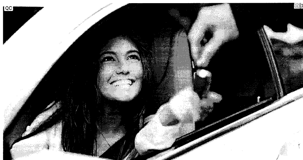
Bán Oto Cũ Đã Qua Sử Dụng - Cam Kết KO Lỗi -Nhận Hồ Sơ Gốc Top Car Chuyên Bán Oto cũ đã qua sử dụng. Bao test theo chỉ định của khách hàng tại gara